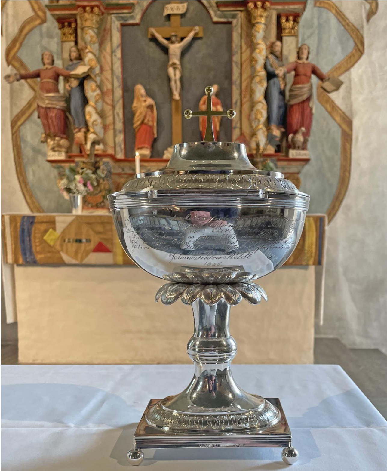
i Motala kyrka